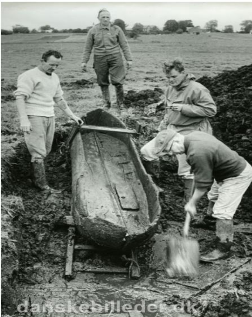
Fund af oldtidsbåd ved Årslevgård, 1964.

Strategisk helhedsplan for Årslev | Høringsportalen - Aarhus kommune